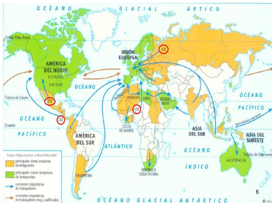
Figura 2. Flujos Migratorios A Nivel Mundial