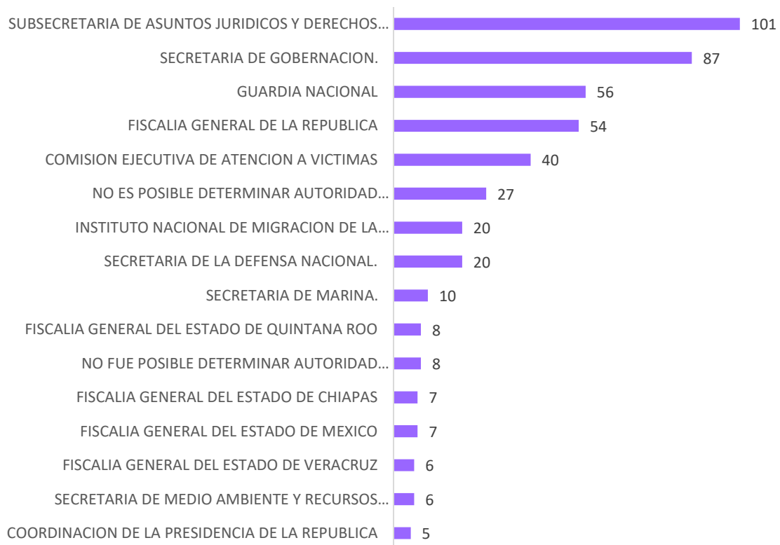
Gráfica 4. Principales autoridades señaladas como presuntas responsables de la violación a derechos humanos de periodistas o personas defensoras de derechos humanos de 2018 a 2022

De acuerdo con los expedientes de presuntas violaciones a los Derechos Humanos de periodistas y personas defensoras civiles de los Derechos Humanos, que esta Comisión Nacional ha recibido durante 2018 a 2022 las principales autoridades relacionadas son: