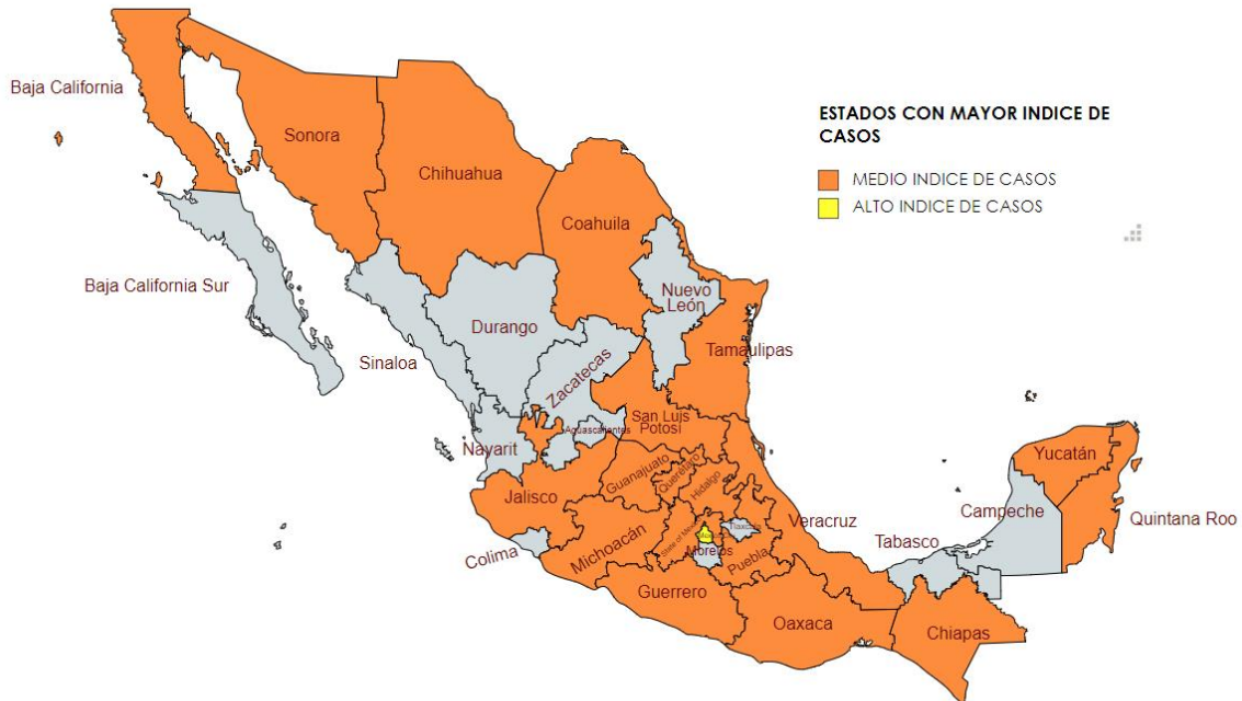
Mapa. Personas Periodistas asesinadas en México con relación a su labor informativa.