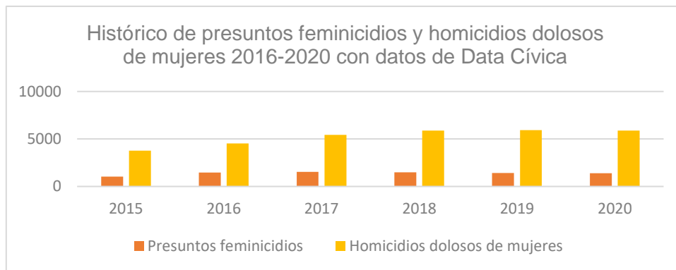
Tabla 3. Comparativo de homicidios dolosos y feminicidios en enero de 2022.

En este sentido, Data Cívica 4 refiere que en 2015 ocurrieron 1031 feminicidios y 3765 homicidios dolosos de mujeres; en 2016 ocurrieron 1467 feminicidios y 4517 homicidios dolosos de mujeres; en 2017 ocurrieron 1528 presuntos feminicidios y 5426 homicidios dolosos de mujeres; en 2018 ocurrieron 1493 presuntos feminicidios; en 2019 ocurrieron 1412 presuntos feminicidios y 5918 homicidios dolosos y en 2020 1398 feminicidios y 5886 homicidios dolosos.