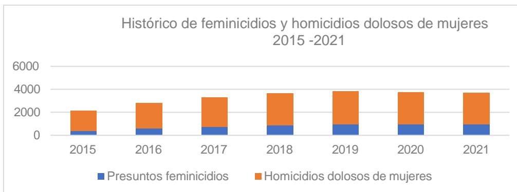
Tabla. Histórico de feminicidios y homicidios dolosos de mujeres 2015-2021. Fuente, elaboración propia con datos del Secretariado Ejecutivo del Sistema Nacional de Seguridad Pública.

De igual forma, los homicidios dolosos de mujeres fueron en aumento de 2015 a 2019 siendo que en 2015 ocurrieron un total de 1,734 en 2015; 2,189 en 2016; 2,535 en 2017; 2,761 en 2018; 2,866 en 2019; hacia 2020 la cifra disminuyó a 2,793 volvió a disminuir un poco en 2021, teniendo 2,740 presuntas víctimas de homicidio doloso, esto con base en el indicador Presuntas víctimas mujeres de homicidio doloso: Tendencia nacional. El Secretariado Ejecutivo señala un total de 777 feminicidios en lo que va de enero a octubre de 2022.